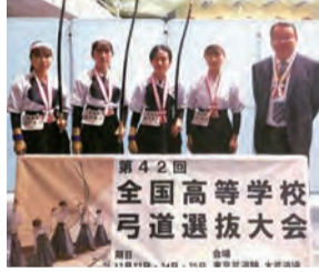
第42回 全国高等学校弓道選抜大会

私たちは、東京都足立区綾瀬で開催された第四十二回全国高等学校弓道選抜大会に、茨城県代表として出場することができました。大会は二日に分かれ、予選とトーナメントで行われ、茨城県代表として出場することができました。大会当日は思いがけないこともありましたが、自分達の射を最後まで突きつめた大会の一つであったため、優勝には届かなかったが、出場が決定したときは嬉しかった。先輩方が引退されて初めての団体での県外大会で緊張と不安が多々ありましたが、仲間と一緒に自信を持ち大会に出ました。