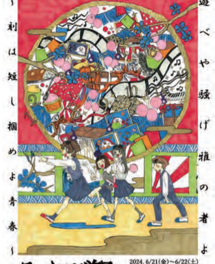
みやび祭 2024.6/21(金)~6/22(土) 一般公開:6/22(土)9:00~15:00 茨城県水戸第二高等学校