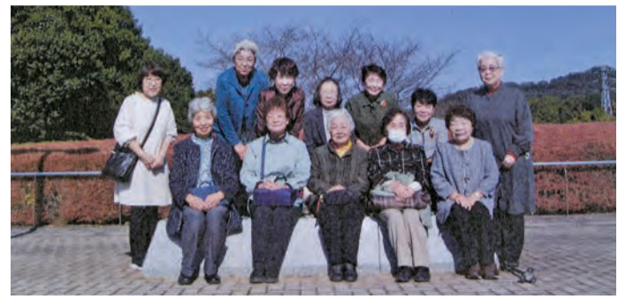
笠間工芸の丘にて